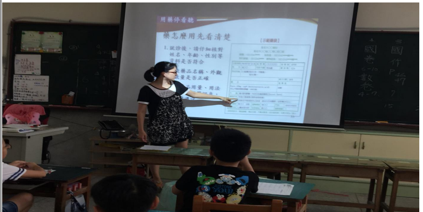
照片說明：教學、討論